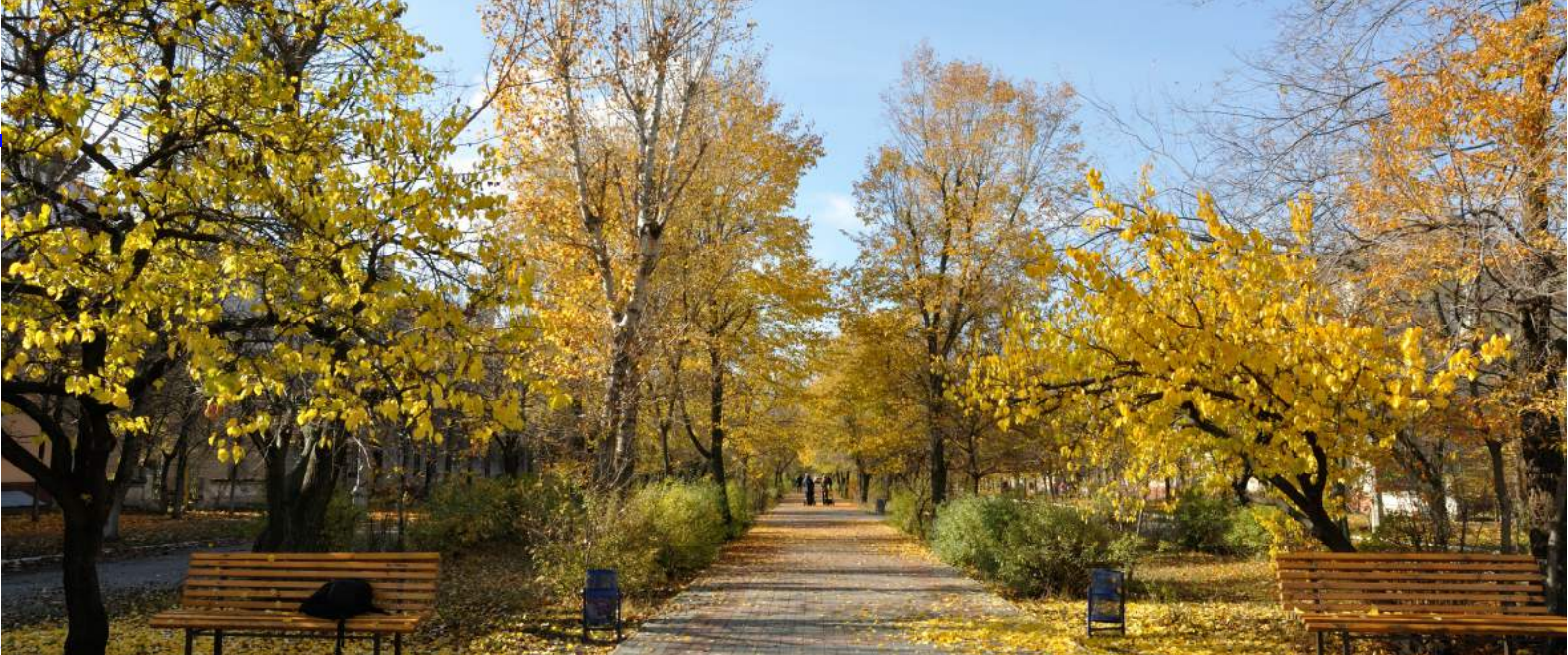
Boulevard im Zentrum