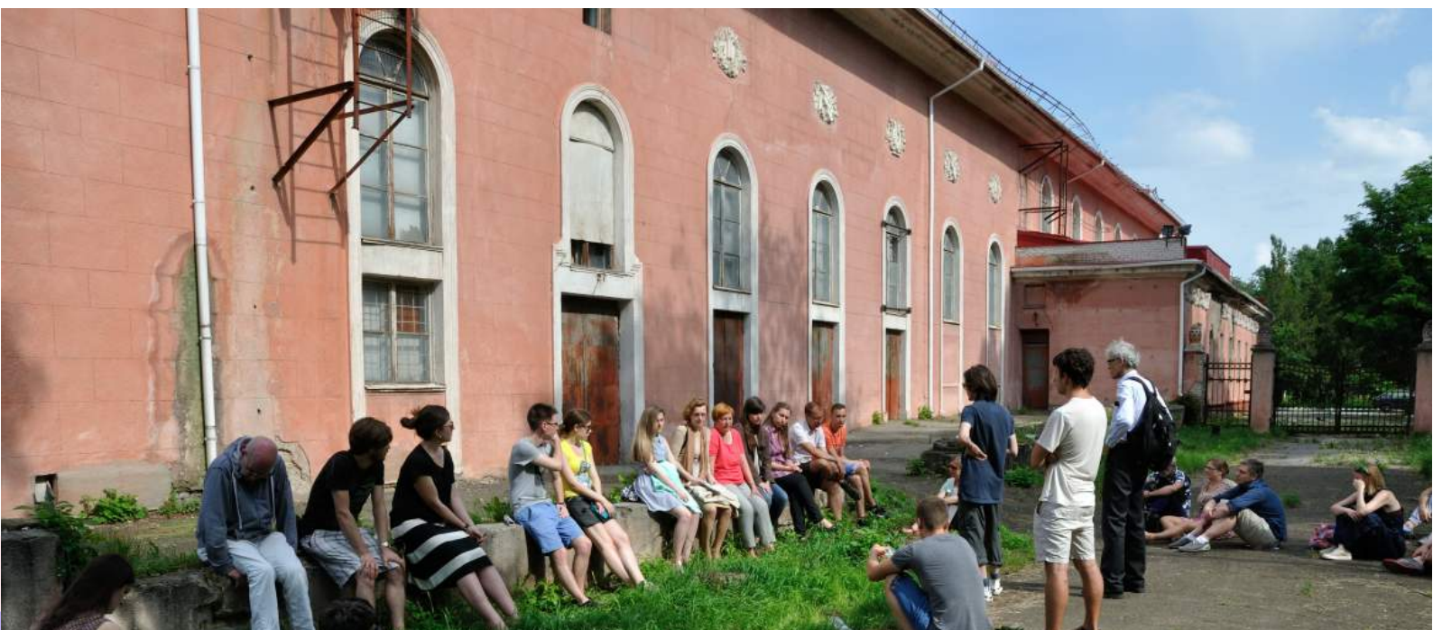
Gespräch mit Vertriebenen