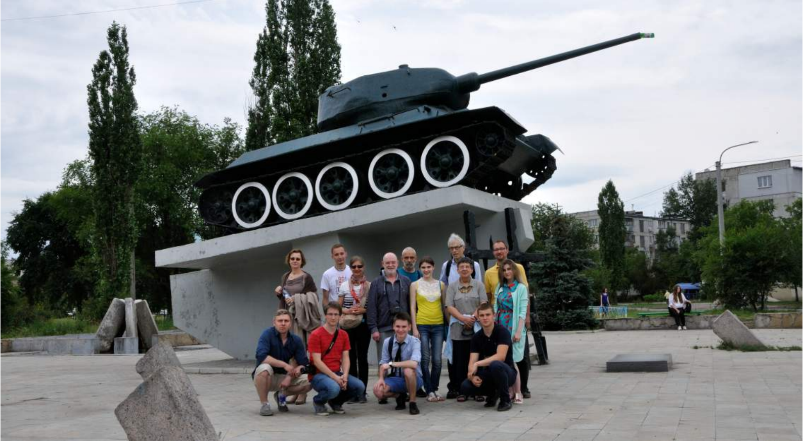
Reisegruppe vor dem Panzerdenkmal